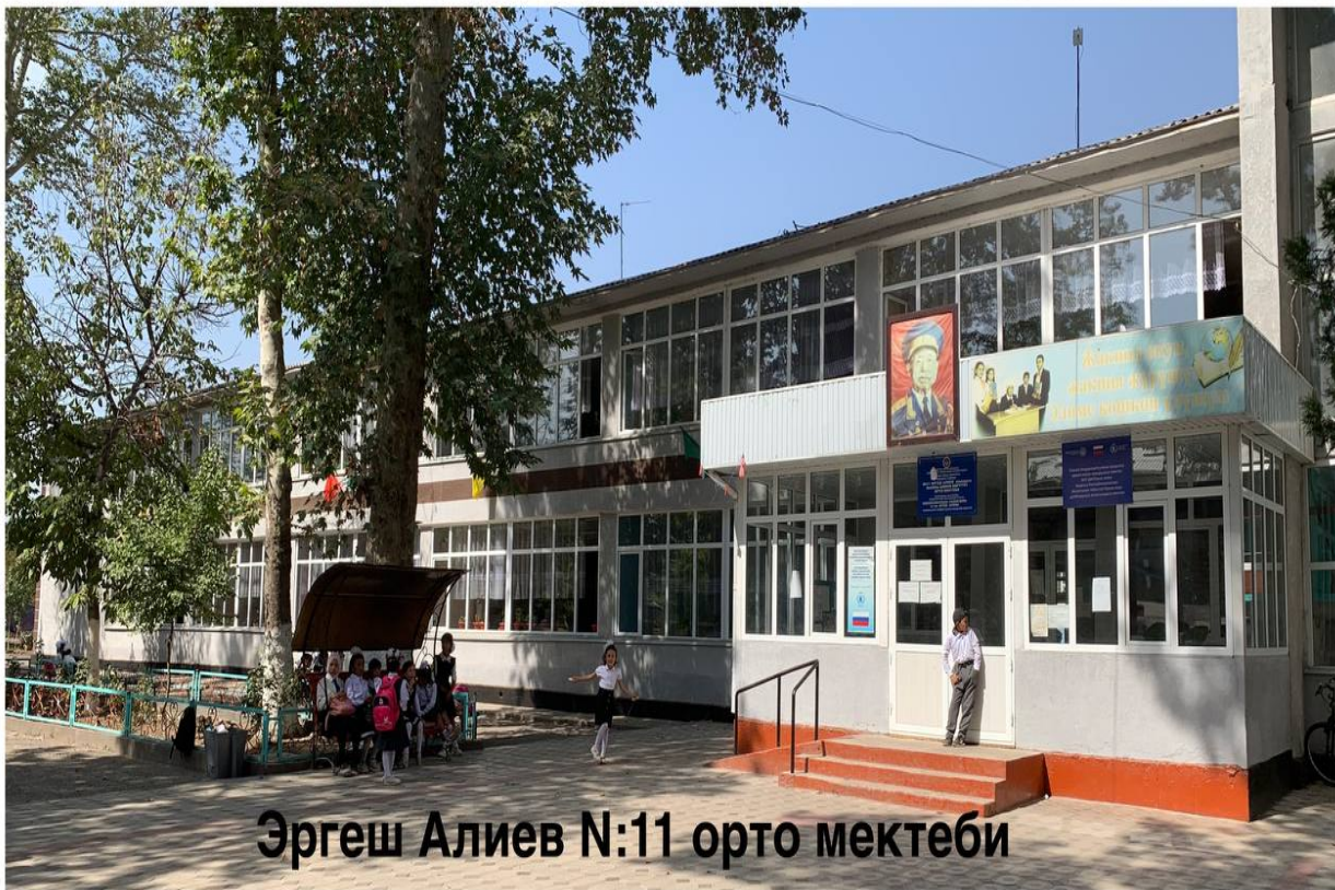
Эргеш Алиев N:11 орто мектеби